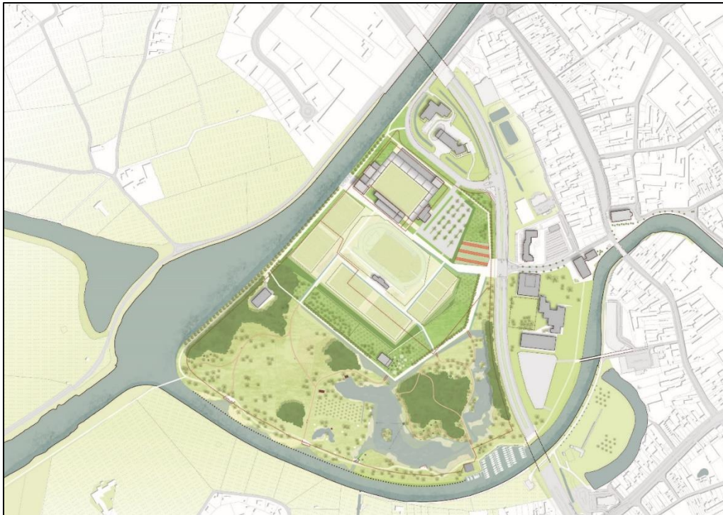
Eindbeeld van het voorkeursscenario

Het gemeentelijk RUP Brielsemeersen, zal, net zoals het vorige PRUP, enkel de hoofdlijnen van het voorkeursscenario juridisch vastleggen.