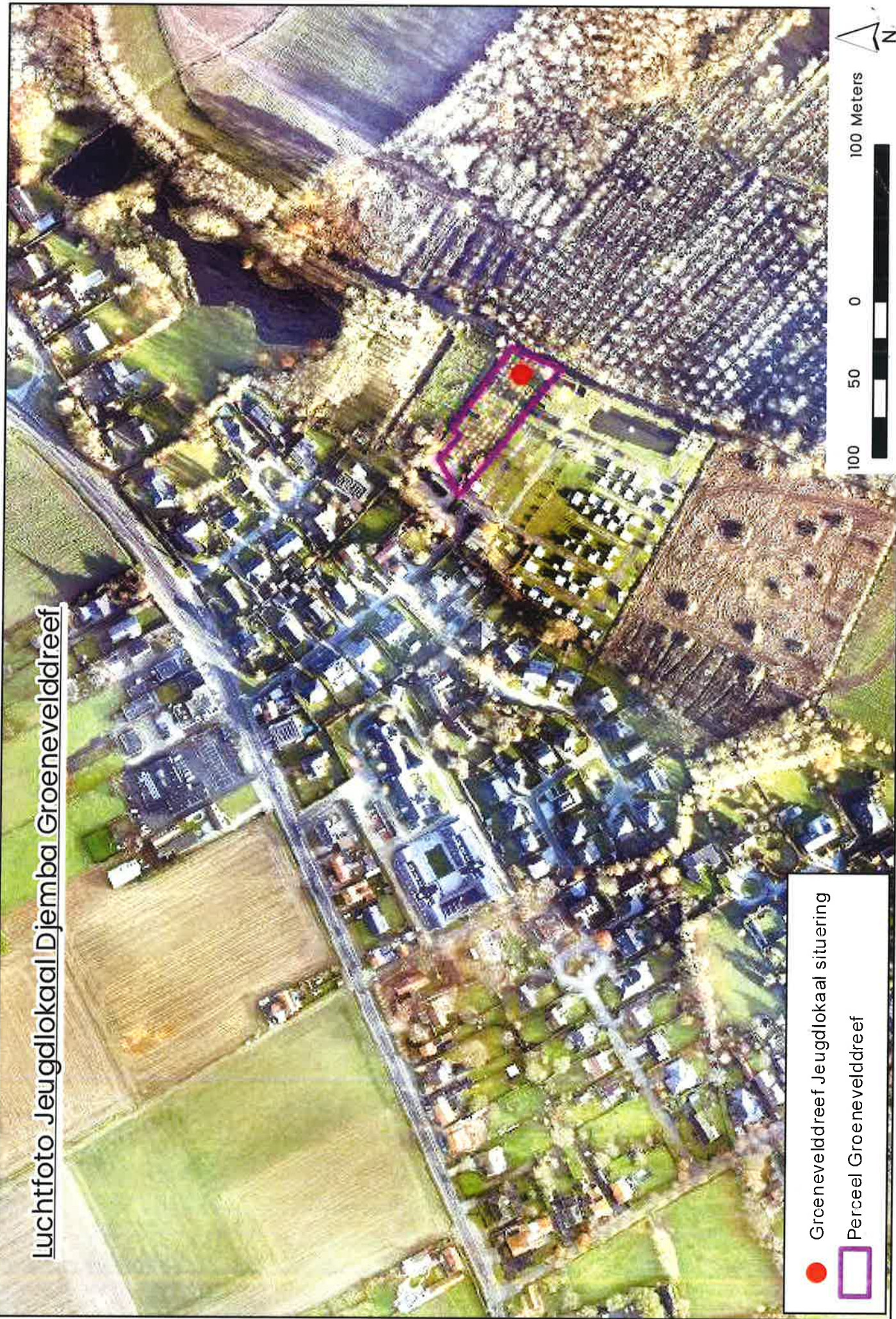
Luchtfoto Jeugdlokaal Djemba Groenevelddreef